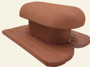
KOMINEK WENTYLACYJNY 160MM